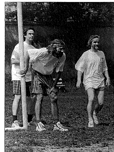
Příkladná koncentrace před rohovým kopem.

hé variantě, neboť je na základě docentských výkonů zřejmé, že kdo se věnuje filosofii, s přibývajícím časem se zlepšuje a v kopané.